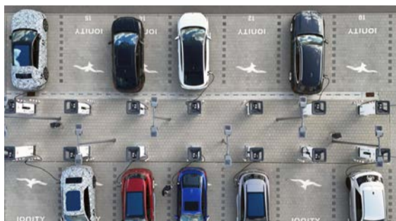
Der österreichische E-Auto-Markt wächst – und mit ihm der Wettbewerb um die Kunden.

Wie sich der Markt für E-Auto-Hersteller in Zukunft entwickelt und wer sich als führende Marke durchsetzen wird, ist aktuell völlig offen. Momentan liegen die fünf größten Hersteller mit jeweils neun bis elf Prozent Marktanteil eng beieinander. Ob sich die chinesischen Elektroauto-Hersteller dabei gegenüber den etablierten Autobauern behaupten können, wird sich zeigen.